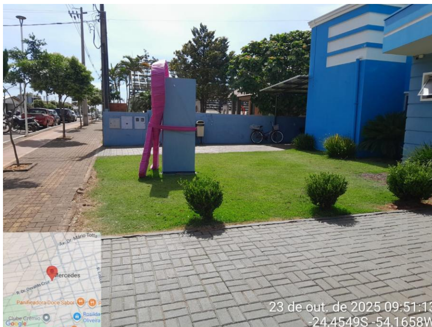
Foto 05: Área de assentamento do calçamento em piso intertravado (paver).