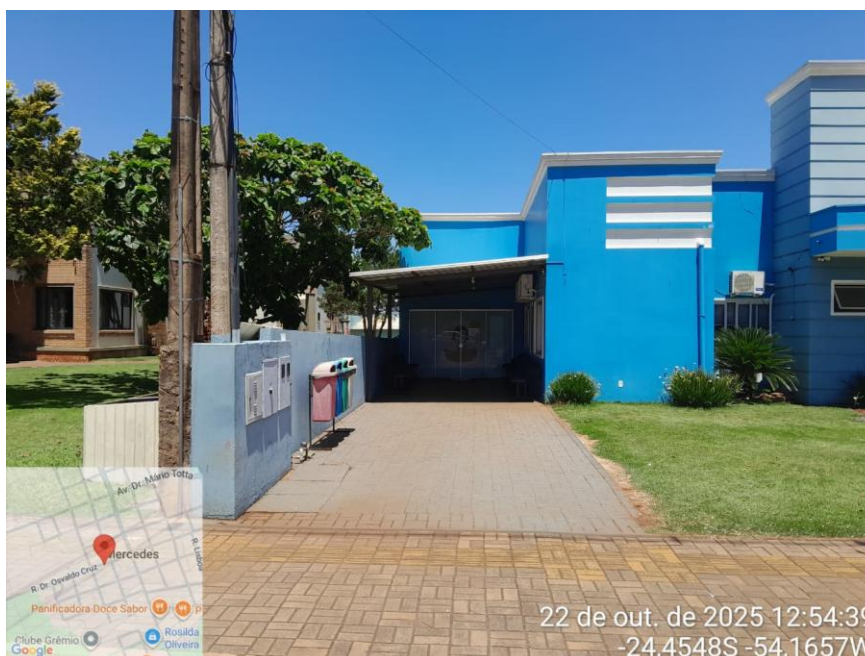
Foto 02: Vista frontal da área de implantação da laje impermeabilizada.